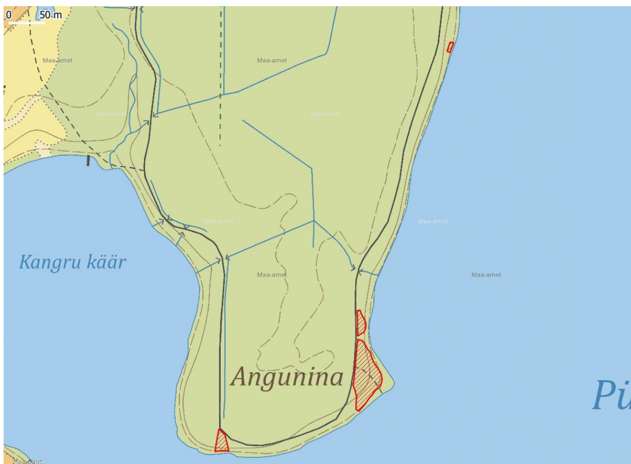
Joonis 1. Punasega märgitud on tähistatud vaadete avamise kohad.

Töö eesmärgiks on järvevaadete avamine Pühajärve matkarajalt.